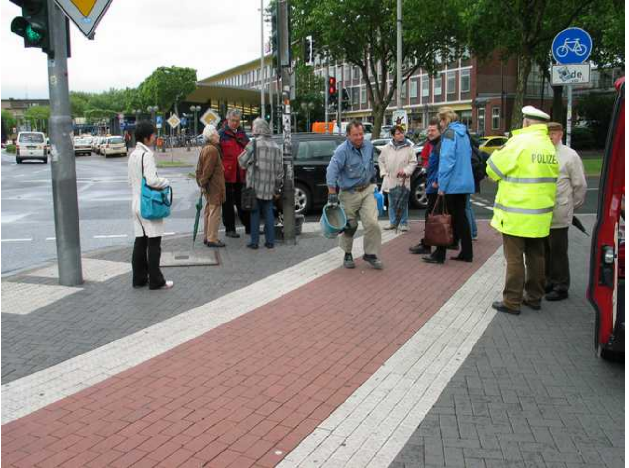
Stolpersteinverlegung am 11. Mai 2007 durch Gunter Demnig vor dem Parkhaus Universitätsstraße Ecke Südring