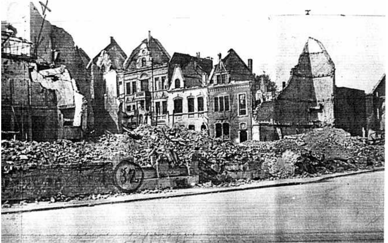
Foto nach 1943 von der zerbombten Brüderstraße mit Markierung der Nummer 32