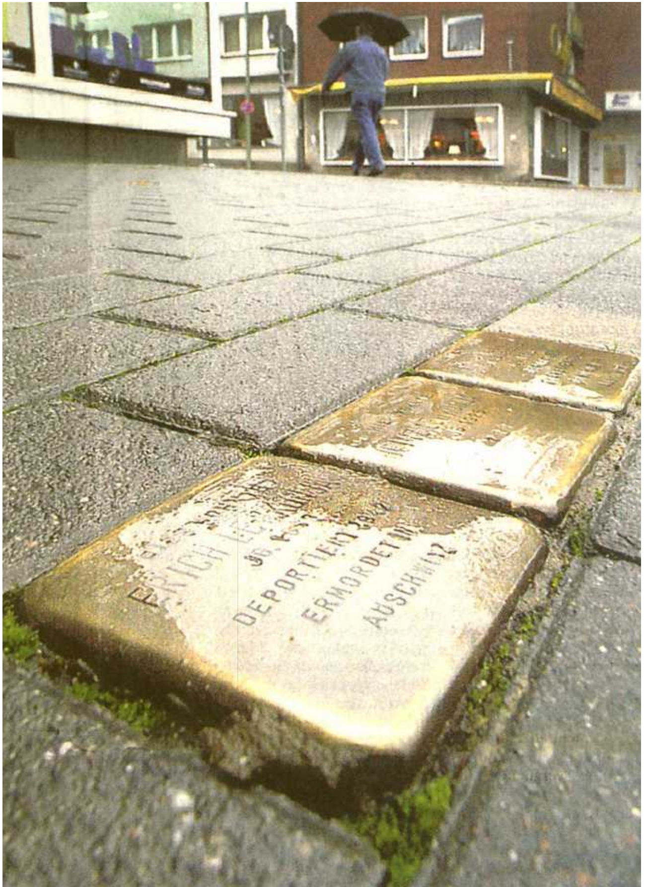
An der Kortumstraße Ecke Nordring wurden die Stolpersteine für Erich, Heinz und Irma Lewkonja am 22. November 2006 durch Gunter Demnig verlegt