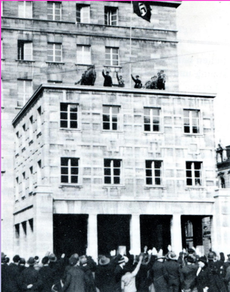
Besetzung des Rathauses am 11. März 1933 (oben) Plakat der NSDAP (rechts)

Wenig später die Macht- ergreifung der Nazis in Bochum. Es folgte der Terror gegen die Arbeiterbewegung und jegliche Opposition.