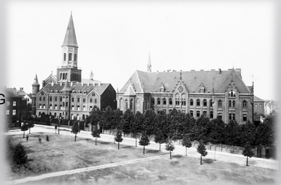
Klosterkirche und Waisenhaus am früheren Kaiser-Friedrich-Platz, ab 1937 Platz der SA, heute Imbuschplatz