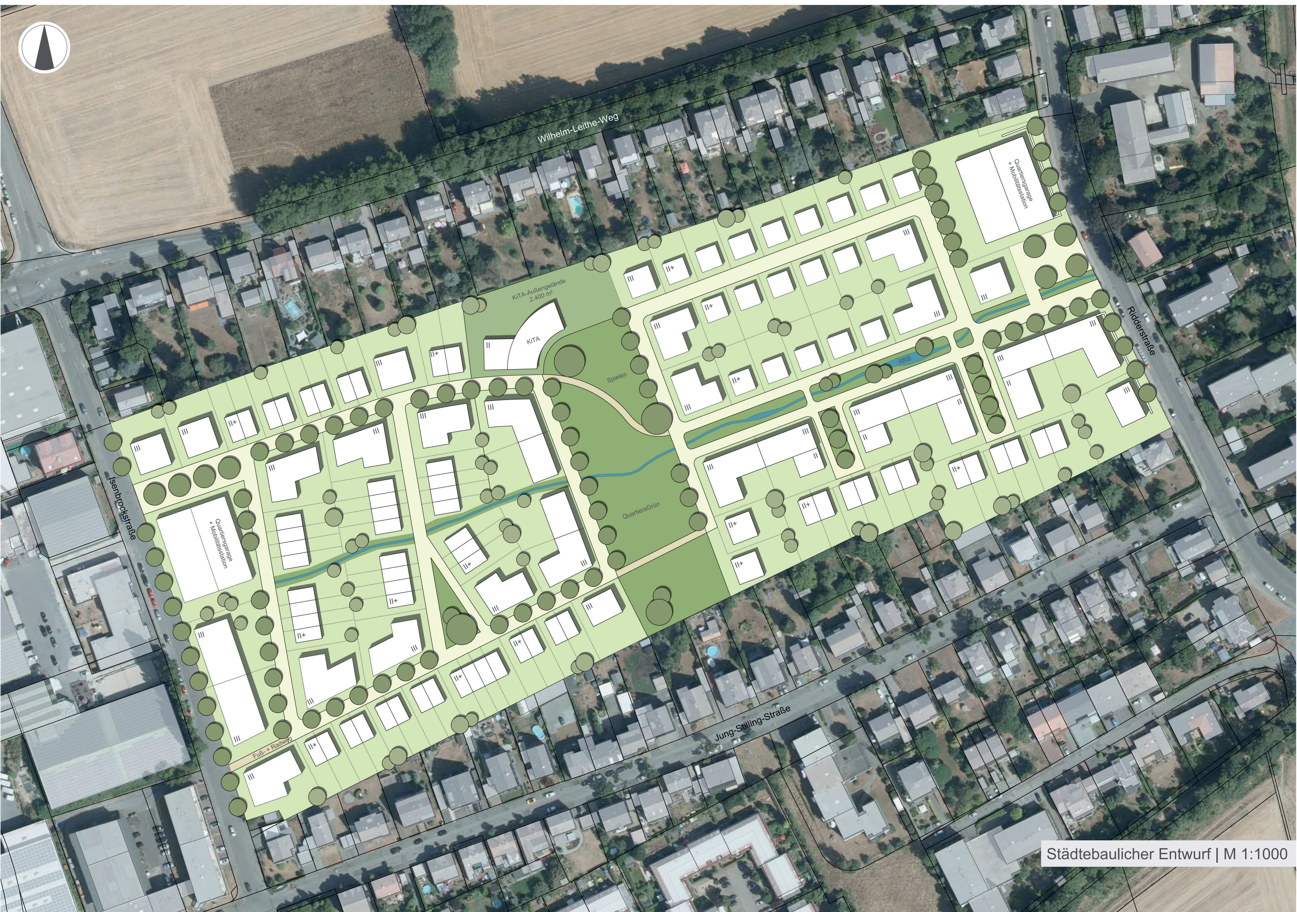
Städtebaulicher Entwurf | M 1:1000