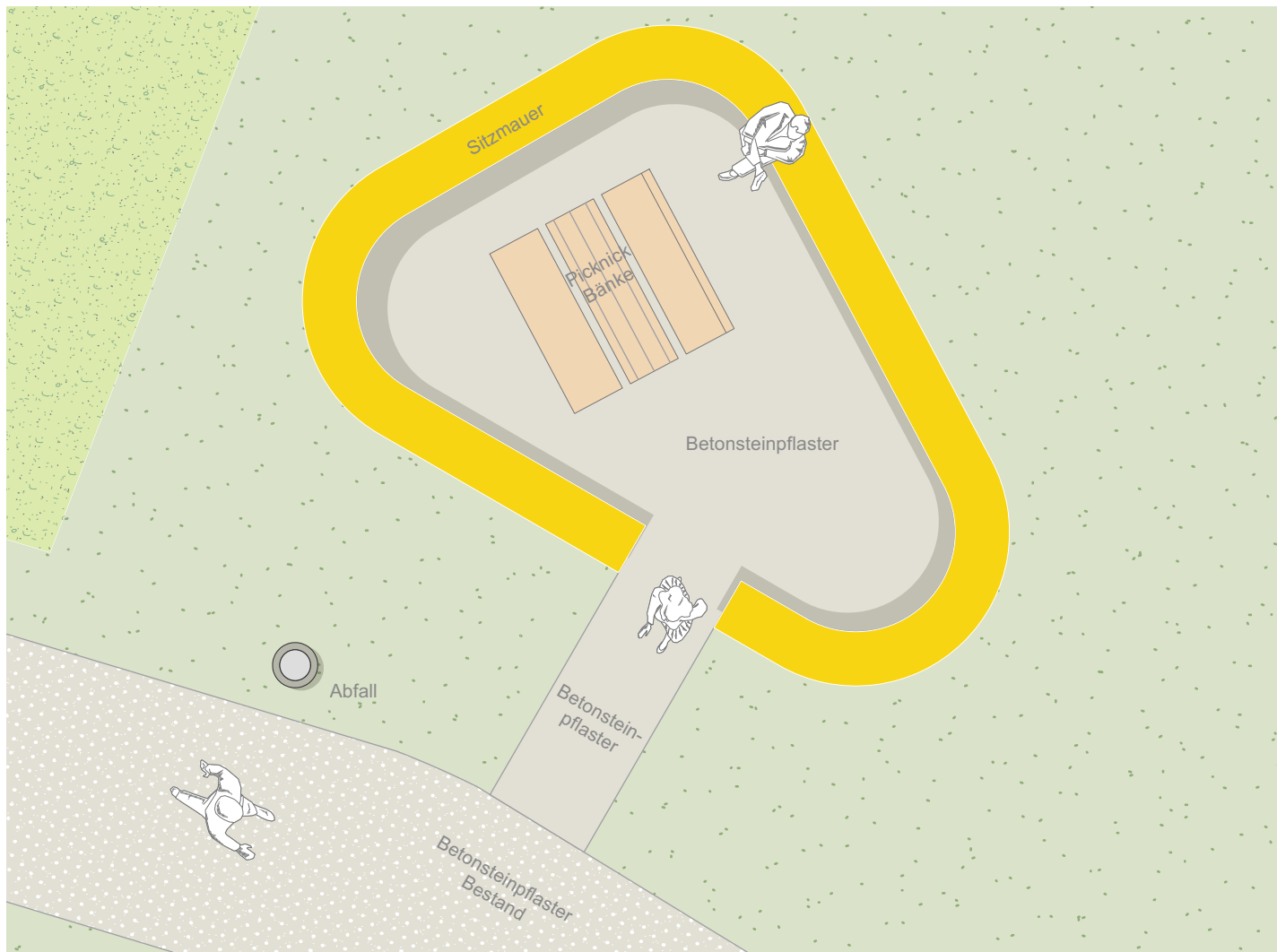
Sitzbereich - 2