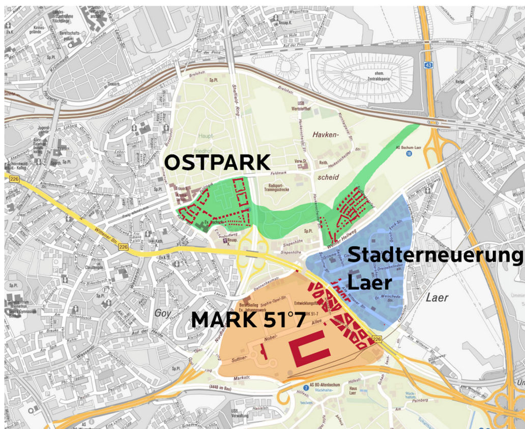
Abbildung 4: Räumlicher Zusammenhang der Entwicklungsflächen OSTPARK und Mark 51°7 und dem Stadterneuerungsgebiet Laer