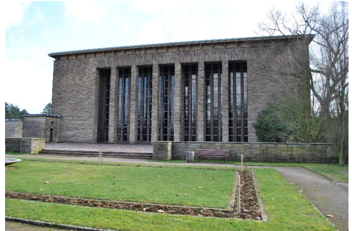
Abbildung 3: Trauerhalle des Hauptfriedhofs