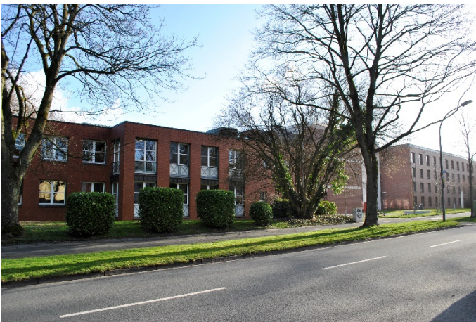
Abbildung 2: Gebäude der Evangelischen Hochschule

In unmittelbarer Nachbarschaft zum Quartier Feldmark liegt mit dem Bochumer Hauptfriedhof eine große öffentliche Grünfläche, die den Bewohnerinnen und Bewohnern des Stadtteils auch zur ruhigen Erholung im Freiraum dient. Die Gebäude des Zentralfriedhofs im Eingangsbereich Freigräbendamm wurden in den 1930er Jahren erbaut und haben den Zweiten Weltkrieg weitgehend unbeschadet überstanden. Das große bauliche Ensemble gibt deutlich den nationalsozialistischen Baustil wieder. Die Trauerhalle mit ihrer beigen Natursteinfassade besitzt aber unbestreitbare architektonische Qualitäten. Der Friedhof mit seinem großkronigen Baumbestand bietet Raum für Besinnung und Erholung. Südlich angrenzend an die Trauerhalle und nördlich der Straße Feldmark befinden sich weitere Verwaltungsgebäude sowie das Krematorium. Östlich daran anschließend befindet sich der Neubau für den zentralen Standort der Friedhofsverwaltung und -unterhaltung sowie eine Wache der freiwilligen Feuerwehr.