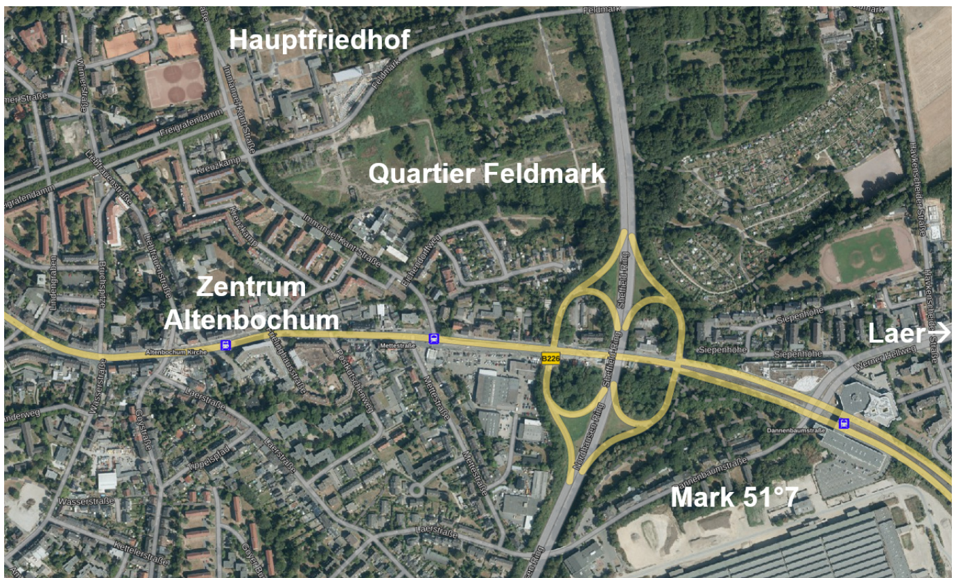
Abbildung 1: Lage des Quartiers Feldmark im räumlichen Zusammenhang (Kartengrundlage TIM-online, eigene Bearbeitung)

Der Stadtteil Altenbochum ist ein beliebter Wohnstandort mit Wohnhäusern unterschiedlichen Baualters und einem lebendigen Stadtteilzentrum. Die zentralen Einrichtungen wie Geschäfte und Dienstleistungen befinden sich hauptsächlich an der Wittener Straße, welche die wichtigste Verbindung zur etwa 3 Kilometer entfernten Bochumer Innenstadt darstellt. In den kommenden Jahren soll der unter anderem für den Wochenmarkt Altenbochum genutzte Friemannplatz eine städtebauliche Aufwertung erfahren. Südlich und nördlich der Wittener Straße befinden sich ruhige Wohnquartiere, die von wertvollen, großkronigen Bäumen im öffentlichen Straßenraum wie auch im privaten Freiraum geprägt sind.