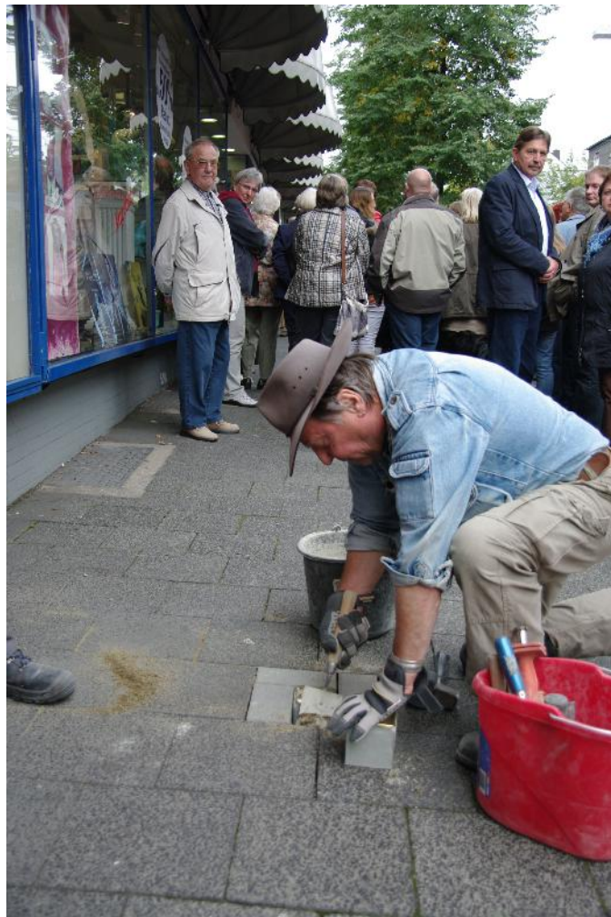
Gunter Demnig bei der Verlegung der Stolpersteine in der Hattinger Straße 776

Zum Schluss möchten wir einigen Personen besonders danken. An erster Stelle danken wir den Naturfreunden für die Unterstützung. Außerdem danken wir unserer Lehrerin und unserem Lehrer für die Leitung und den Einsatz für den Projektkurs. Da wir anfangs in der Archivarbeit sehr unbeholfen waren gilt besonderer Dank an unsere Stadtarchivare aus Hattingen und aus Bochum, welche sehr geduldig und hilfsbereit waren, egal wann wir ihre Hilfe brauchten. Vielen, vielen Dank!