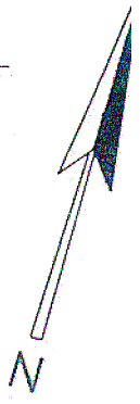
Lageplan Feld 19