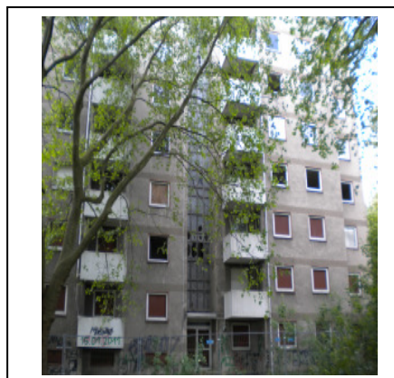
Hochhaus, leerstehend vor Abriss