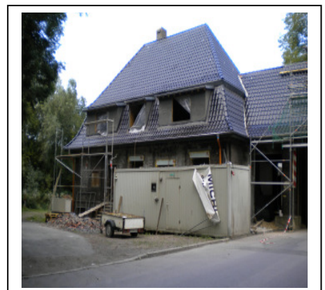
Sanierung eines Wohnhauses