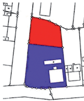
nach dem Verfahren