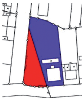
vor dem Verfahren