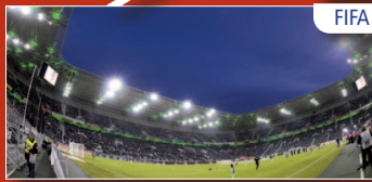
Stadion im Borussia-Park MÖNCHENGLADBACH