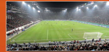
FIFA Frauen-WM-Stadion AUGSBURG