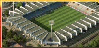
FIFA Frauen-WM-Stadion BOCHUM