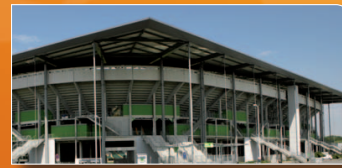
FIFA Frauen-WM-Stadion WOLFSBURG