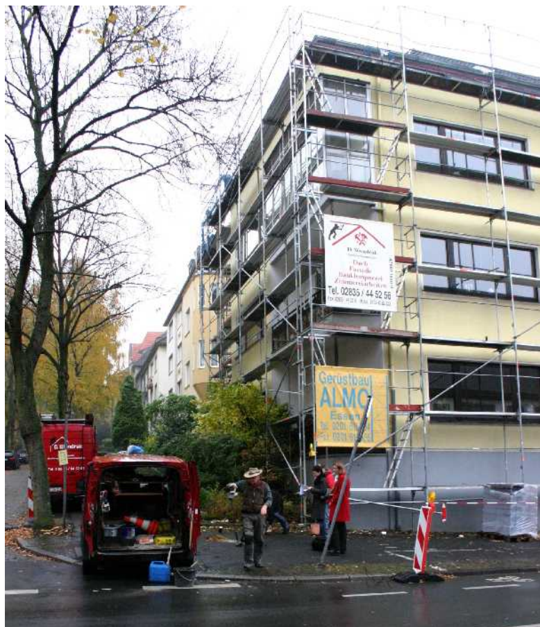
Foto des heutigen Eckhauses bei der Stolpersteinverlegung durch Gunter Demnig

Für Dr. Wilhelm Hünnebeck wurde am 2. November 2007 ein Stolperstein verlegt am Standort Bergstr./Am alten Stadtpark 67.