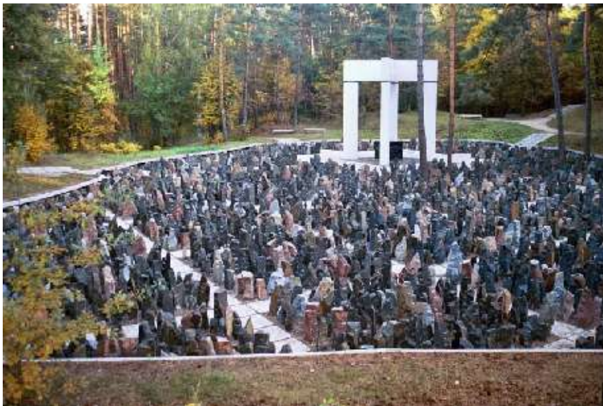
Gedenkstelle im Wald von Bikernieki

Der Dortmunder Transport war am 1. Februar 1942 in Riga angekommen und ins sogenannte „Reichsjudenghetto“ gebracht worden. Schon bald ging man daran, die alten und nicht mehr voll arbeitsfähigen Menschen auszusortieren. „Dünamünde“ war ein Tarnbegriff: Die Aussortierten sollten dort in einer Fabrik leichtere Arbeiten verrichten, so sagte man ihnen. Nur: In Dünamünde ist nie ein Transport angekommen. Das war auch schon bald den im Ghetto zurückgebliebenen Menschen klar: Die Fahrzeit nach Dünamünde betrug mindestens 30 Minuten für einen Weg, der LKW mit den Abtransportierten war aber schon nach 20 Minuten wieder zurück, um die nächste Menschengruppe zu übernehmen. Wie wir heute wissen, wurden die Menschen in den nahegelegenen Wald von Bikernieki gebracht, dort in vorbereiteten Massengräbern erschossen. 55 Massengräber und eine zentrale Gedenkstelle erinnern heute dort an den Massenmord.