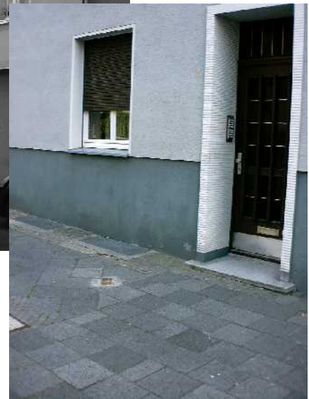
Querenburger Straße 24 im Jahr 2006