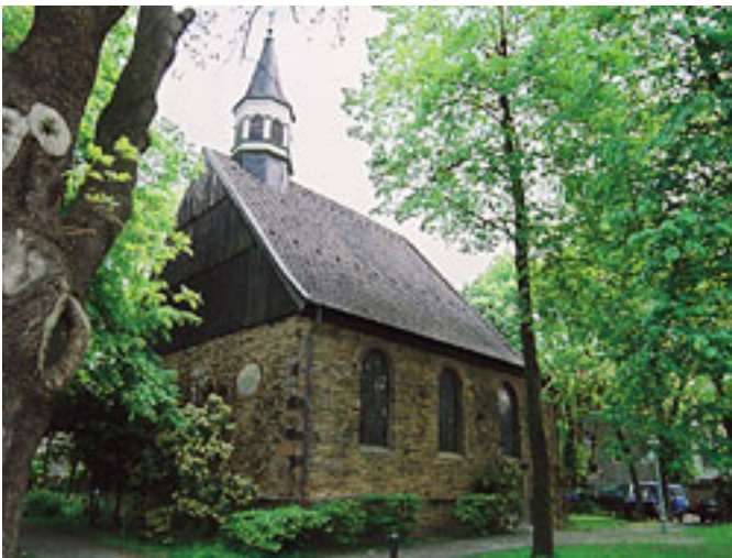
Kirche am "Alten Markt"