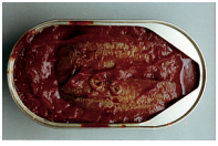
Fischdose mit Würmern