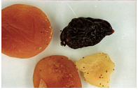
Insektenbefall von Trockenobst